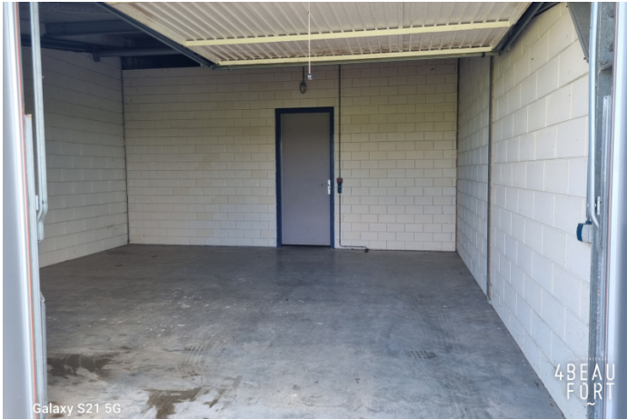
Galaxy S21 5G