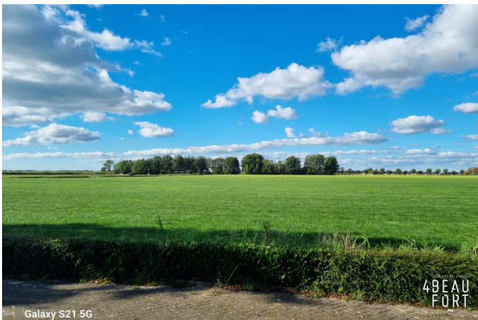
Galaxy S21 5G